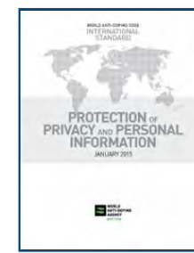
МС по сохранению конфиденциальности информации о частных лицах