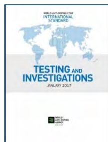
МС по тестированию и расследованиям