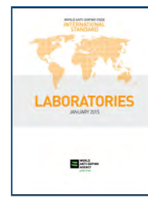
МС для лабораторий