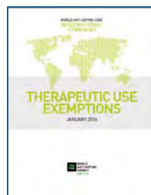
МС по терапевтическому использованию